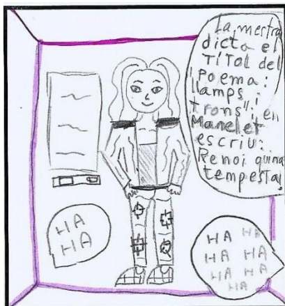
L'acudit de l'Ariadna